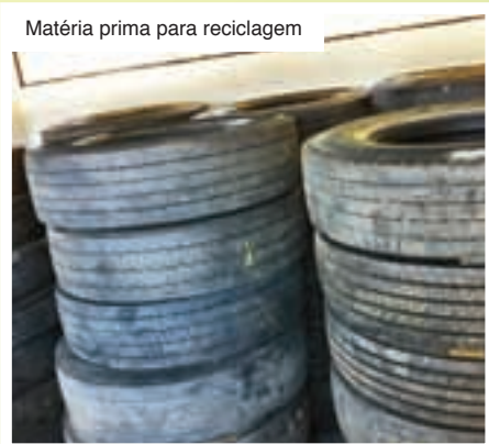
Matéria prima para reciclagem