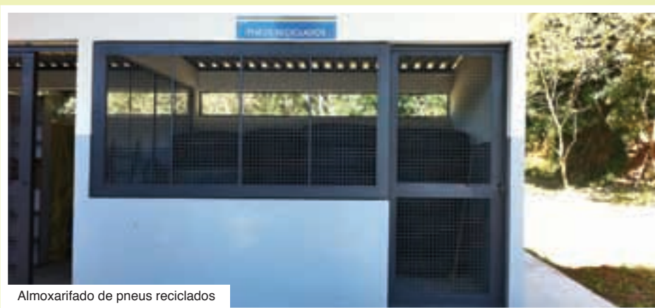
Almoxarifado de pneus reciclados

A Viação Nossa Senhora do Amparo reaproveita, mensalmente, 120 pneus, 2.200