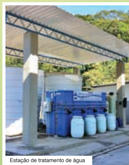
Estação de tratamento de água

litros de óleo, 9 toneladas de ferro, 50 baterias, 100 Kg de plásticos e vidros e 300 Kg de papel. Além disso, trata noventa por cento da água utilizada na lavagem dos ônibus, nas garagens de Maricá e Rio do Ouro, através da tecnologia físico-química, e faz o reúso da mesma na limpeza da frota. Atualmente, a empresa economiza 2,5 milhões de litros de água por mês, em suas duas estações de tratamento. <