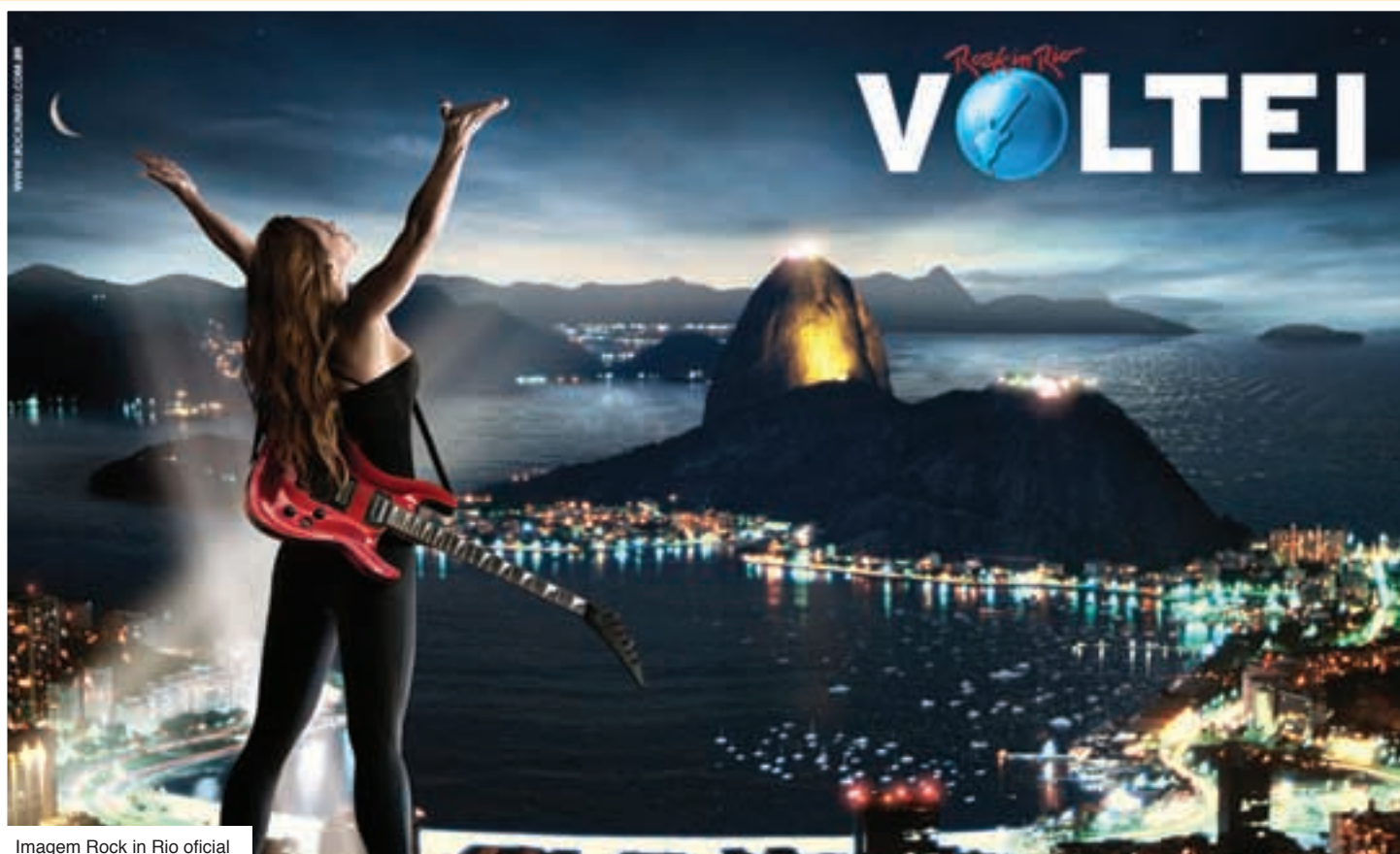
Imagem Rock in Rio oficial